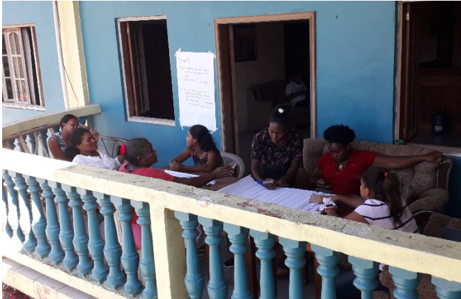
Sesión de trabajo no mixta, Junio 2019