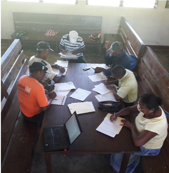
Práctica de levantamientos de actas – Ahuas, noviembre 2019