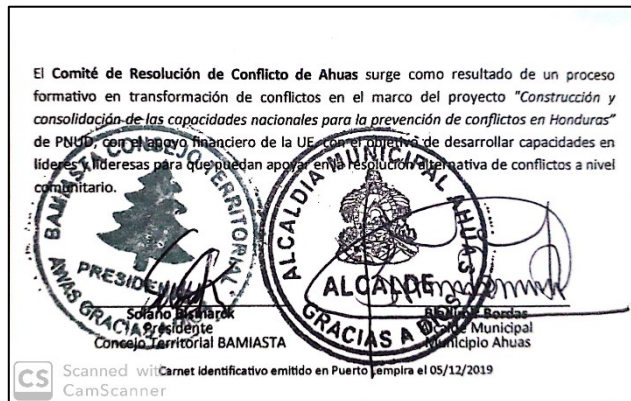
Carnet de mediador/a firmado por el alcalde de Ahuas y el presidente del CT Bamiasta