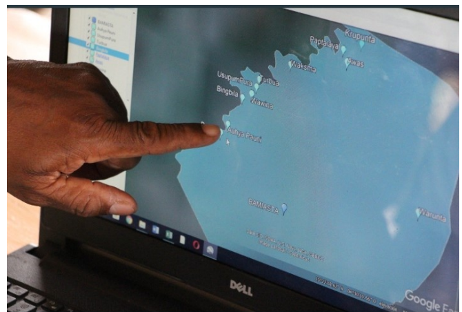
Taller de presentación y validación del mapeo de las OSC a los CT (31 de octubre 2019, Parada)