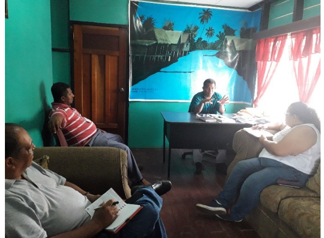
Entrevista de C-Libre con el alcalde de Puerto Lempira, Junio 2019