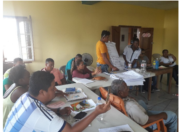
Prácticas informe DISRRAC, Junio 2019