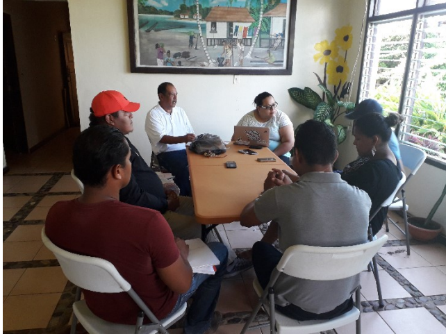
Entrevista de C-Libre con la Red de Comunicadores/as de La Moskitia, junio 2019

entregado aún el documento a pesar de que desde PNUD se contratara a una consultora de C-Libre para facilitar las labores de análisis y sistematización de la información recolectada en terreno.