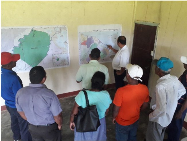
Validación del mapa del CT de Bamiasta (27 de noviembre 2019, Ahuas)