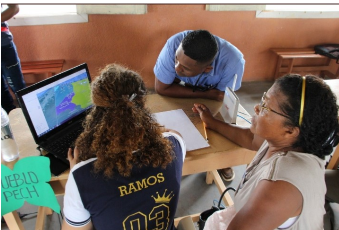
Taller de presentación y validación del mapeo de las OSC a los CT (31 de octubre 2019, Parada)

Así mismo, en el marco de los talleres de validación (31 de octubre 2019), se organizó un conversatorio con los/as presidentes/as de los CT de los 4 pueblos a cerca de la creación de una red de OSC (indicador 2.1 del proyecto). De manera consensuada los CT definieron que debido a los problemas internos que padecen sus organizaciones como consecuencia de la creación de otras paralelas necesitaran acercarse a las organizaciones identificadas en cada territorio para conocer los propósitos de su conformación, visión de desarrollo y deseo de trabajar juntos antes de proceder a la creación de una red.