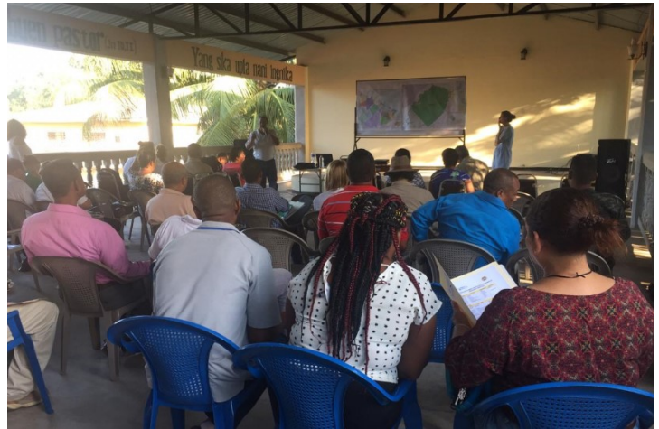
Presentación de los mapas físicos y del mapeo digital de las OSC previo a la reunión de la Plataforma de Gobernanza Territorial (2 de diciembre 2019, Puerto Lempira)