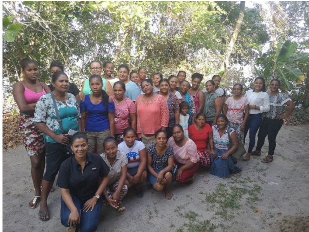
Taller de devolución y validación, Julio 2019

Actualmente el documento se encuentra en fase de diagramación e impresión y se espera poder distribuirlo con las participantes a inicios del próximo año.